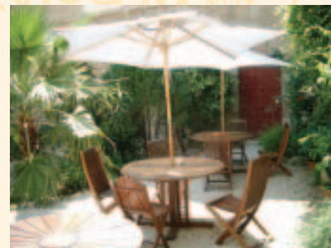
Petits déjeuners servis à l'ombre en été En verano se servirán los desayunos en la sombra de una palmera

Pasen el porche del castillo y vengán a descubrir el jardín interior plantado de esencias mediterráneas.