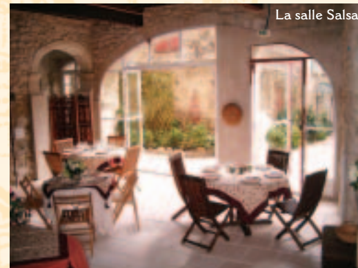
La salle Salsan