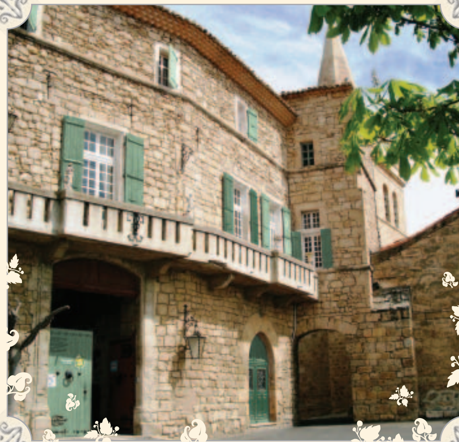
Accolé à son église, le château domine le village médiéval en circlade de Murviel les Béziers. Encaramado con la iglesia en el corazón de Murviel-lès-Béziers, el castillo domina este pueblo medieval de calles circulares.