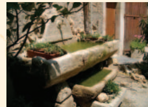
Pourquoi pas un apéritif à côté de la fontaine ? Y por qué no un aperitivo al lado de la fuente ?